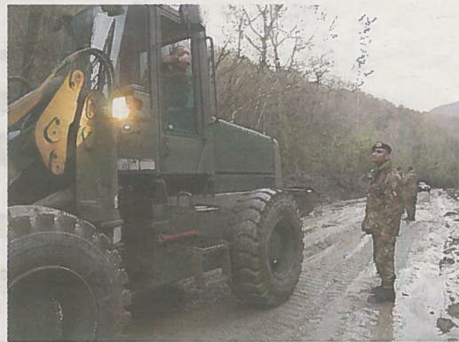
L'esercito al lavoro sulla frana sulla statale 120 nel 2014